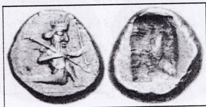
تصویر ۱-۵ نقش کمان دار پارسی، نخستین سکه سیگلولی داریوش بزرگ

در پشت سکه نیز چند فرورفتگی مشاهده می شود. همچنین سکه ای از داریوش سوم به دست آمده است که به جای نیزه خنجر را به دست گرفته است (تصویر ۱-۵).