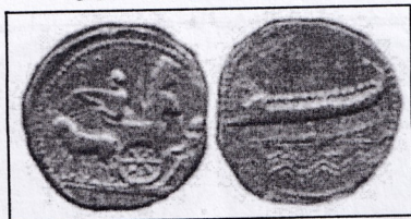
تصویر ۱-۷ نقش کشتی جنگی و اردشیر سوم هخامنشی را سوار بر گردونه

بر سکه نقره دیگری نقش اردشیر دوم کمان به دست ایستاده و در پشت سکه نقش کشتی جنگی با بادبان نقر شده است. (۷۴۴-۳۵۸ پ.م) که با مشاهده این سکه می توان به تاریخ دریانوردی ایران در دوره هخامنشی و وضع کشتی های جنگی و اهمیت آن ها پی برد (تصویر ۱-۷).