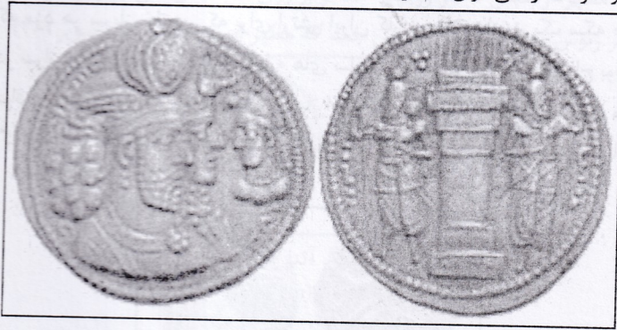
تصویر ۱-۸ نقش بهرام دوم ساسانی به همراه ملکه پوران دوخت و ولیعهد http://www.sekeha.com [Accessed 5 november 2014]

سکه های دوره ساسانیان از اهمیت بسیار بالایی برخوردارند، پارس در زمان هخامنشی موقعیت بسیار مهمی داشته از زمان سلطنت بهرام منجم (۳۹۱-۴۲۰ میلادی) نام شهرها بر روی سکه ها ضرب گردید. سکه های ساسانی دارای انواع تاج ها، آرایش مو و چهره و جواهرات گرانبها بر روی تاجها می باشند. بر پشت سکه ها معمولاً نقش آتشدان با شعله های فروزان وجود دارد و در اطراف آن دو نگهبان که شاه یا ولیعهد یا دو تن از شاهزادگان می باشند، منقوش است. ولی بر پشت بعضی از سکه های طلا تصویر ملکه یا آلهه قرار دارد که از دور سر وی نوری ساطع است. نوشته های روی سکه به خط پهلوی ساسانی و نام القاب شهپریان ساسانی است. سکه های جالب توجه این دوره سکه های اردشیر اول، شاپور اول، هرمزد دوم، بهرام دوم با ملکه و ولیعهد و ملکه پوران دوخت را می توان نام برد (تصویر ۱-۸).