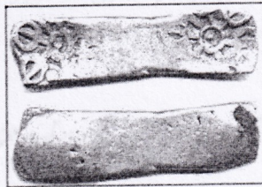
تصویر ۱-۱ قدیمی ترین وسیله برای مبادلات، ۶۵۰ سال پیش از میلاد مسیح

در دنیای کهن و پیش از به وجود آمدن سکه داد و ستد مردم به شیوه مبادله کالا صورت می گرفته و پایه مقیاس و میزان مبادله کالا چهارپایان بوده اند، بر روی نقاشی ها و سنگ نوشته های قدیم صحنه های از داد و ستد که به وسیله جابه جایی صورت می گرفته، مشاهده می شود. در دوران پیدایش فلزات تمدن بشر نیز تکامل خود را طی نمود و بشر از فلزات مختلف مانند مس، برنز، طلا و نقره آشیایی به اشکال مختلف مانند حلقه و استوانه یا چهارگوش و یا به صورت تبر و کارد تهیه نمود و وسیله جابه جایی برای داد و ستد قرار گرفت، برای مثال در چین فلزی به شکل کارد یا میله های باریک یا حلقه ساخته می شده است (تصویر ۱-۱).