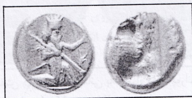
تصویر ۱-۶ نقش کمان دار پارسی، نخستین سکه زرین دریک داریوش بزرگ

سکه های نخستین هخامنشی به نام سکه های شاهی معروف بوده است. قدرت مالی هخامنشیان بسیار زیاد بوده به طوری که مزد هر سرباز خارجی که برای ارتش ایران کار می کرده است یک سکه طلا (دریک) در ماه بوده است. در سراسر ایران هخامنشی ضرابخانه های سلطنتی بنا بر آن چه که احتیاج بود سکه ضرب می کردند ولی در مواقع لزوم بروز جنگ فرمانروایان یا ساتراپ های محلی که اطراف پادشاه مامور تشکیل و تدارک ساز و برگ و جنگ افزار بودند سهم بیشتری برای ضرب سکه از خزانه سلطنتی دریافت می کردند ۹۹ (تصویر ۱-۶).