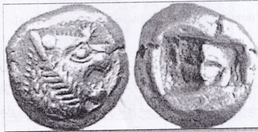
تصویر ۱-۲ نخستین سکه جهان از جنس آلکتروم (طلا و نقره) در کشور لیدی http://www.sekeha.com [Accessed 5 november 2014]

در مورد پیدایش مسکوک و قدیمی ترین مملکتی که برای اولین بار به ضرب آن اقدام نمود، می توان از جزایر یونانی نشین آسیای صغیر نام برد. قدیمی ترین سکه های لیدی به شکل قطعه پهن نامنظمی است از مخلوط نقره و طلا (آلکتروم) که در روی آن شیارهایی موازی و پشت سکه چند فرورفتگی حک شده است و گاهی در بعضی از این فرورفتگی ها نقش حیوانی شبیه روباه به چشم می خورد زیرا روباه در لیدی مورد پرستش اهالی بوده است. در دوره کروزوس شاه لیدی سکه هایی معروف به کروزیید بوجود آمد که می توان آن را نخستین سکه حقیقی جهان دانست (بیانی، ۱۳۳۹: ۸) (تصویر ۱-۲).