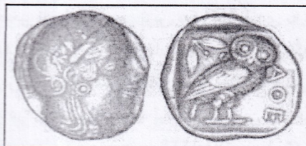
تصویر ۱-۴ نقش آتنا آلهه یونانی

این نقوش متنوع کمک بزرگی به روشن شدن مذاهب دنیای قدیم کرده است. مثلاً در روی سکه های اژین نقش لاک پشت که مظهر آرتمیس دختر ژوپیتر است و بر روی سکه های آن در یک طرف تصویر آتنا آلهه یونانی اندیشه، دختر ژئوس و در طرف دیگر نقش جغد که مظهر اوست می باشد (تصویر ۱-۴).